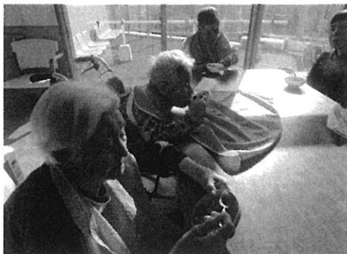
1月19日(土) 白玉ぜんざい作り