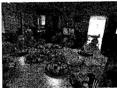
豪華な鉢盛を囲んで