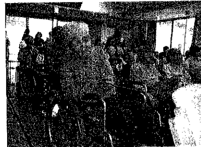
敬老会での一コマ